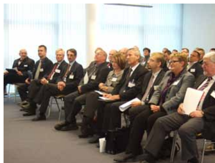
Während der Eröffnung des Deutsch-Polnischen Wirtschaftstages im MOEZ.