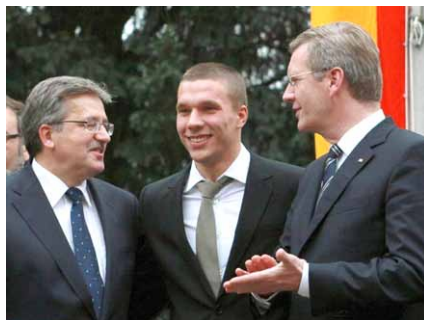
Polnischer Präsident Bronisław Komorowski mit Fußballstar Lukas Podolski und Bundespräsident Christian Wulff in Darmstadt (v.l.n.r.)