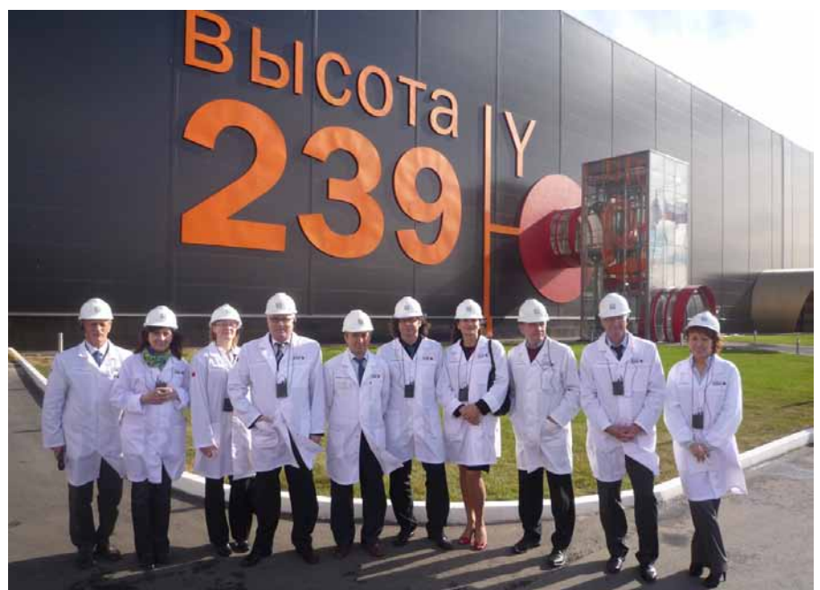
Beim Besuch des Tscheljabinsker Röhrenwalzwerkes zeigte sich die deutsche Delegation beeindruckt von den modernen Produktionsanlagen.

Elsen: Die Kooperationsbörsen bilden das tatsächliche Marktgeschehen ab und sind keine Einbahnstraße. Sie waren sehr lebendig, offen und hochkonstruktiv. Es wurde sehr schnell deutlich, dass es eben nicht