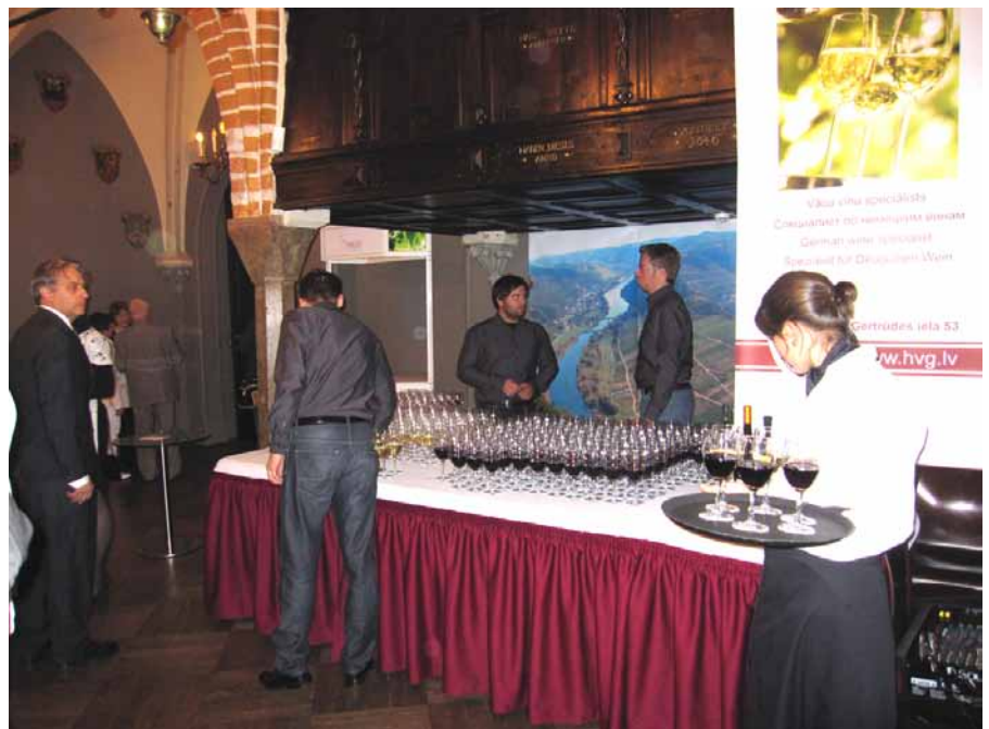
Rheinland-pfälzische Winzer beim Empfang in der Großen Gilde in Riga