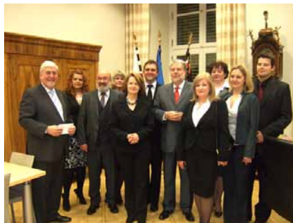
Zahlreiche Vertreter aus Politik und Wirtschaft beider Länder nahmen am gemeinsamen deutsch-polnischen „Parlamentarischen Abend“ am 9. November teil.