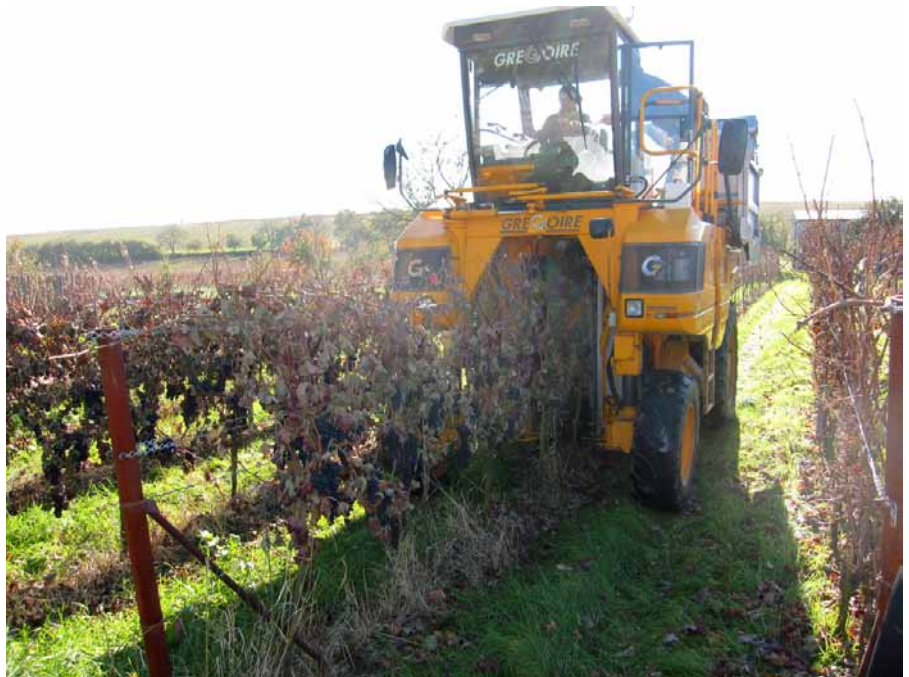
Selbst das Lesen mit dem Traubenvollernter konnte den russischen Gästen beispielhaft in der Praxis gezeigt werden

Die Einkäuferreise ist Teil der Aktivitäten des MOEZ zur Unterstüt-